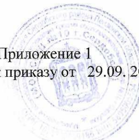
График проведения школьного этапа Всероссийских предметных олимпиад школьников